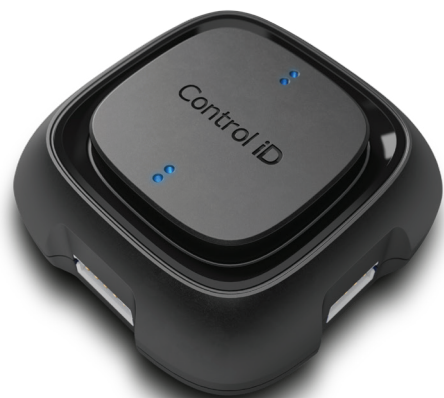
(Módulo de Acionamento)